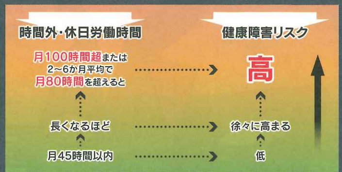
過重労働と健康リスクとの関連性

(右の図は、労災補償に係る脳・心臓疾患の労災認定基準の考え方の基礎となった医学的検討結果を踏まえたものです。)